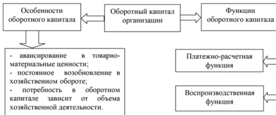
Рис. 1. Особенности и функции оборотного капитала

Внутри фирмы оборотный капитал непрерывно осуществляет оборот, переходя из одной формы в другую. Оптимизация скорости перемещения данных ресурсов между стадиями цикла (Деньги → Сырье, материалы и другие ресурсы → Производство → Готовая продукция → Деньги) становится определяющим фактором для повышения эффективности всей хозяйственной деятельности. Если цикл замедляется на каком-либо этапе, организация сталкивается с сокращением рентабельности, что обуславливает необходимость аналитического выявления причин подобных задержек и последующего принятия управленческих мер.