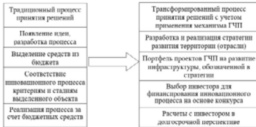
Рис. 3. Трансформация процесса принятия решений по организации и финансированию инновационного процесса с учетом механизма ГЧП

В литературе по экономике и менеджменту (теоретического и прикладного характера) понятие «механизм» достаточно часто применяется в словосочетаниях: «хозяйственный механизм», «рыночный механизм», «производственный механизм», «экономический механизм», «организационный механизм», «организационно-экономический механизм» [9].