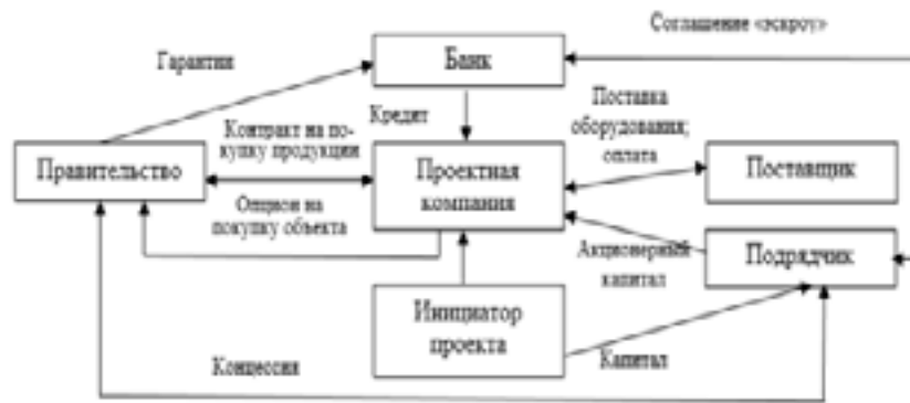
Рис. 1. Типовая схема концессии модели «BOT»