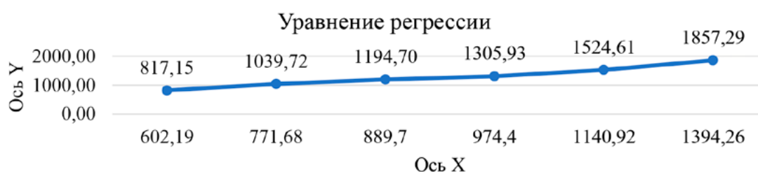
Рис. 2. Уравнение регрессии

Связь между показателями, а именно величиной расходов по статье «Вооруженные Силы РФ» и общей величиной расходов по разделу «Национальная оборона» – весьма высокая.