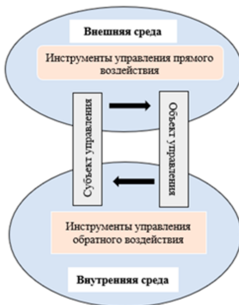
Рис. 1. Взаимосвязь инструментов управления во внутренней и внешней среде предприятия