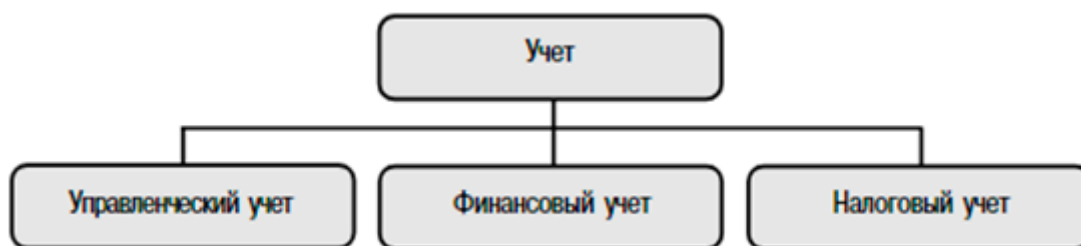
Рис. 1. Учетные системы организации [1]