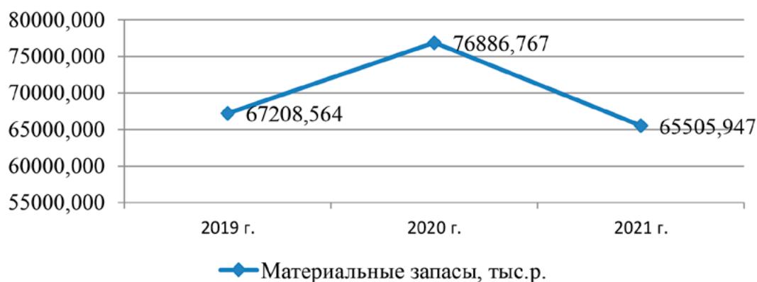
Рис. 2. Динамика материальных ФГБОУ ВО «Институт» за 2019–2021 гг., тыс. р.

Данные таблицы 6 показывают, что значительная доля в составе основных средств ФГБОУ ВО «Институт» по источникам финансового обеспечения (деятельность, приносящей доход) приходится на машины и оборудование. Их доля в конце 2021 года составляет 65%. В конце отчетного периода также наблюдается увеличение данного показателя.