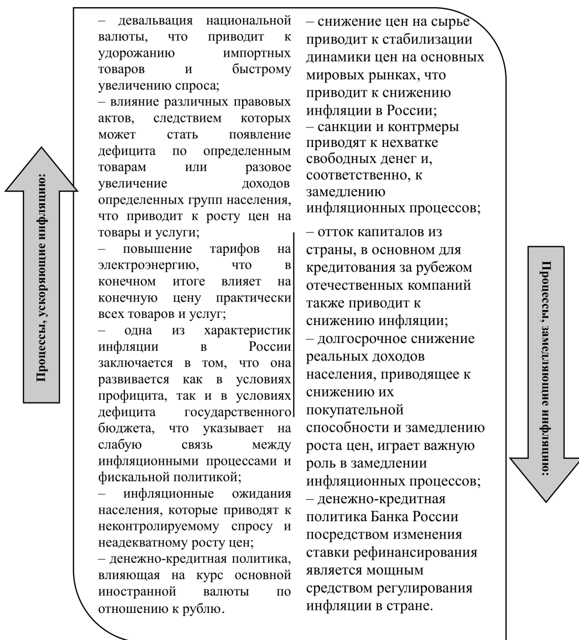
Рис. 1. Процессы, ускоряющие и замедляющие инфляцию в Российской Федерации [составлено автором]

Инфляция в российской экономике имеет свои особенности и проблемы. Основными проблемами снижения инфляции в России являются: зависимость внутренних цен на энергоносители от мировых цен на нефть; превышение цен на продукцию естественных монополий; ухудшение качества денег в связи с преобладанием иностранной валюты и сокращением кредитного канала для эмиссии; вывод средств в стабилиза-