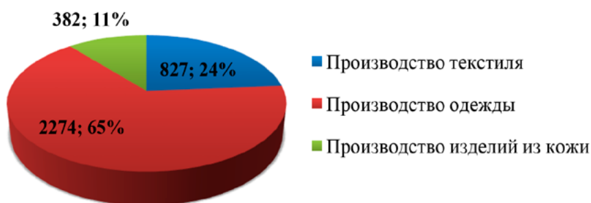
Рис. 1. Структура предприятий легкой промышленности Санкт-Петербурга в 2020 г. от числа зарегистрированных