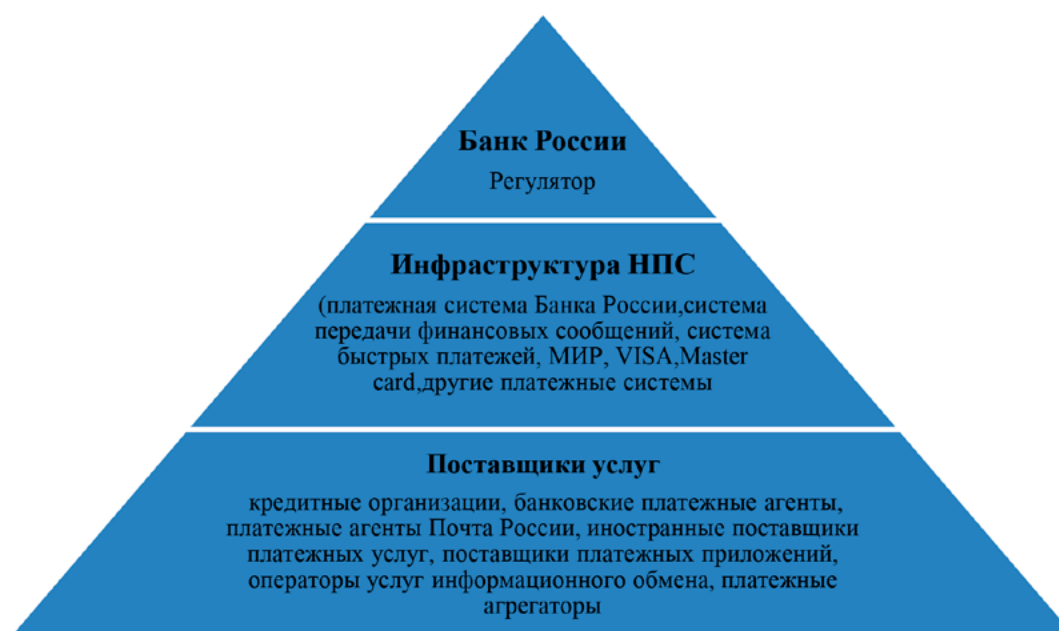
Рис. 1. Национальная платежная система России

На начало 2017 года к ПС «Мир» присоединились 169 российских кредитных организаций, российскими эмитентами было выпущено около 2 млн карт «Мир», количество которых постоянно растет.