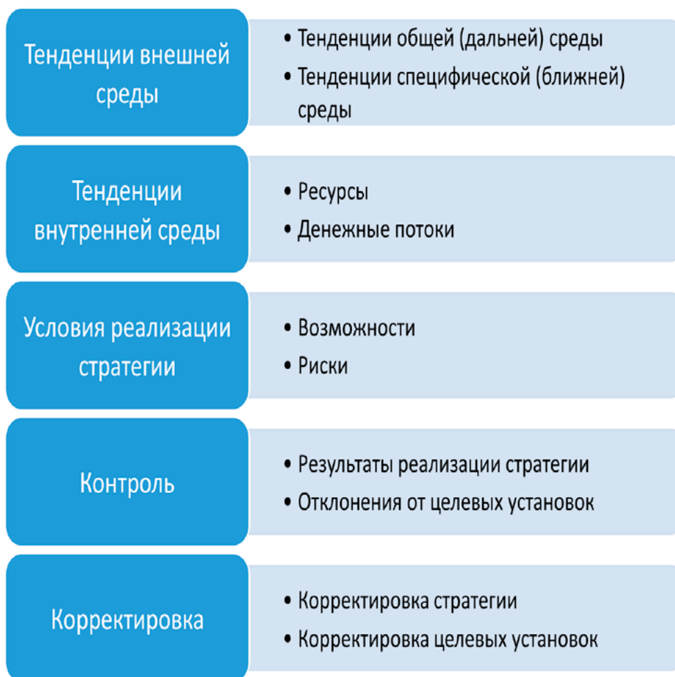
Рис.4. Структура информационной базы в системе стратегической управленческой отчетности