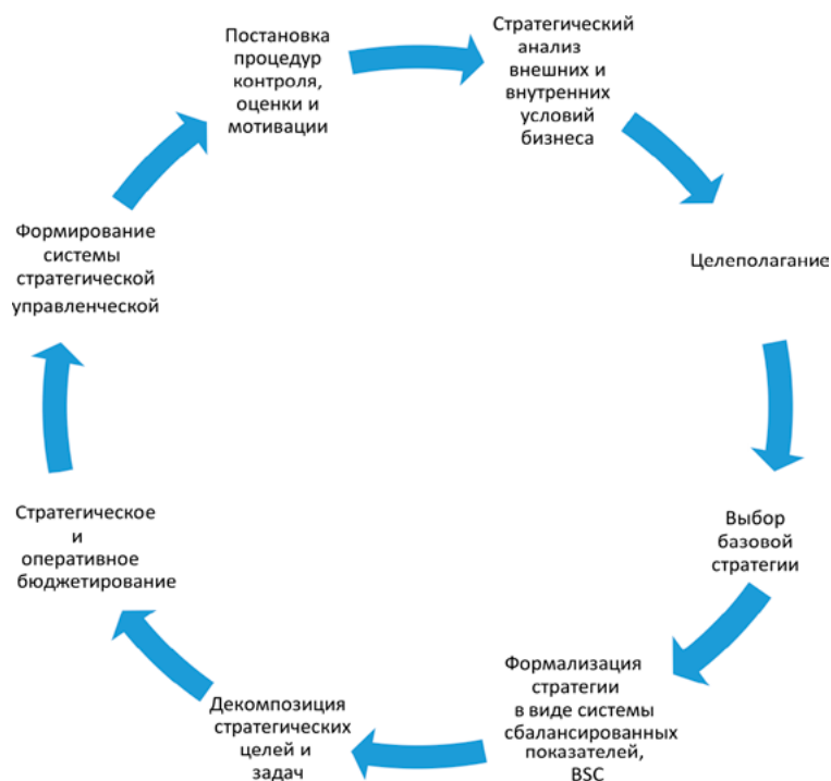
Рис. 1. Структурно-логическая связь элементов системы стратегического управленческого учёта

Концепция стратегического управленческого учёта позволяет разработать модель структурирования информационного потока в системе стратегической управленческой отчетности (рис. 4).