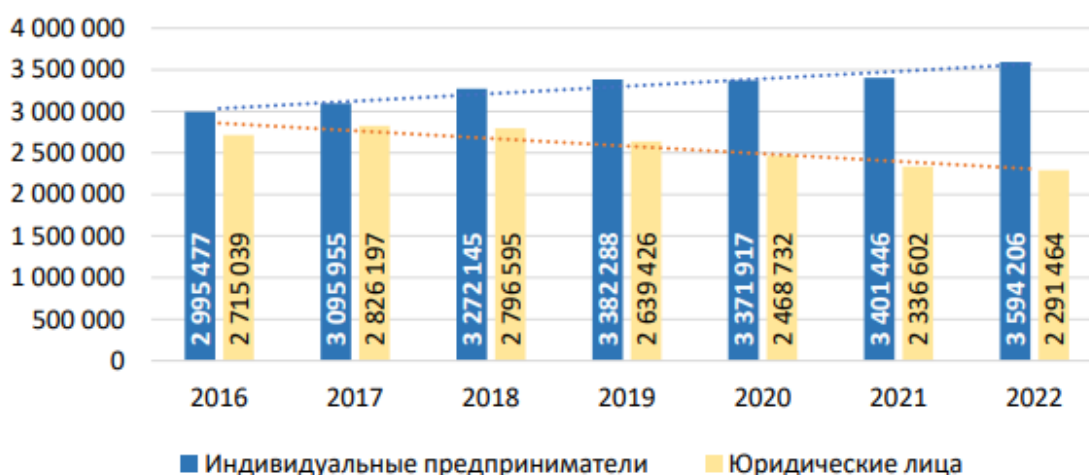
Рис. 2. Количественное соотношение индивидуальных предпринимателей и юридических лиц – субъектов сектора МСП за 2016–2022 гг. (расчитано с применением средних значений за год) [3]

В последнее время отмечено два источника повышения эффективности уже реализуемых льгот. К ним относится цифровизация содействия и увязка позволенных мер на федеральном и региональном уровне друг с другом. Предприниматели слабо изучили имеющиеся инструменты, поэтому им нужны консультации. С учетом страновой специфики и больших требований во внешней торговле, они могут стать эффективным механизмом помощи [4].