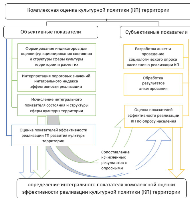
Рис. 1. Схема алгоритма разработки интегрального показателя комплексной оценки эффективности реализации культурной политики территории

Разработанная комплексная методика оценки эффективности реализации государственной культурной политики региона объединяет объективный (оценка культурных процессов с помощью объективных показателей и оценка эффективности реализации государственной культурной политики территории) и субъективный (субъективная оценка населением мер культурной политики, проводимой администрацией региона) подходы.