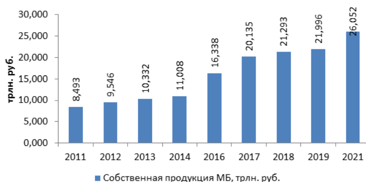
Рис. 2. Динамика стоимости собственной продукции малого бизнеса в Российской Федерации, трлн. руб.