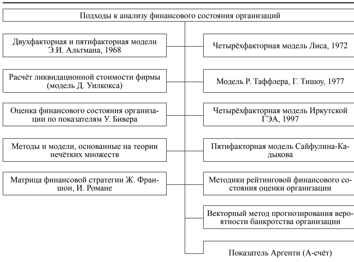
Рис. 1. Основные подходы к анализу финансового состояния организаций*