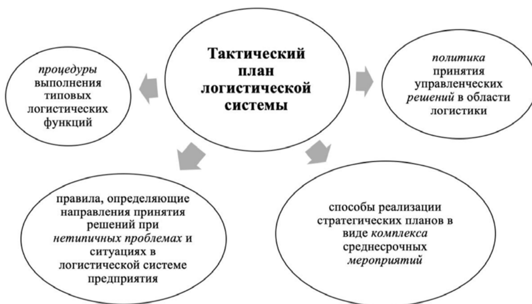
Рис. 2. Отображение содержания тактического плана логистической системы [Авторы]