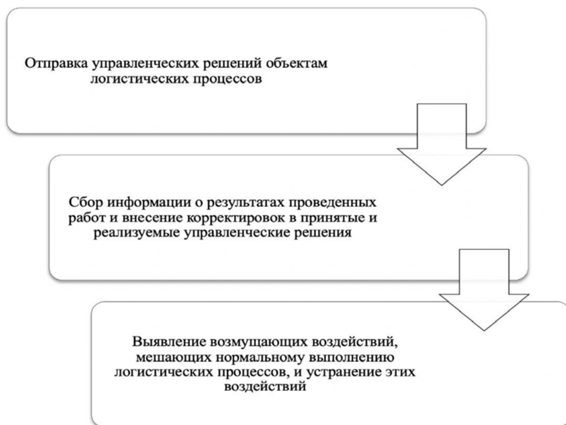
Рис. 3. Процесс оперативного управления инновационной логистической деятельностью организации [Автор]

Инновационное развитие процессов логистического планирования и использование новых форм организации логистических процессов должно поддерживаться системой управления логистикой, которая должна быть создана в компании [4]. Организация логистики предприятия проходит в трех направлениях: выбор организационной формы внешних и внутренних материальных потоков; определение формы управления; определение и распределение логистических функций и процессов. В то же время, авторы не сомневаются, что инновационная организация логистической деятельности компании требует целостности и согласованности работ по всей цепочке «поставщик – производство – потребитель».