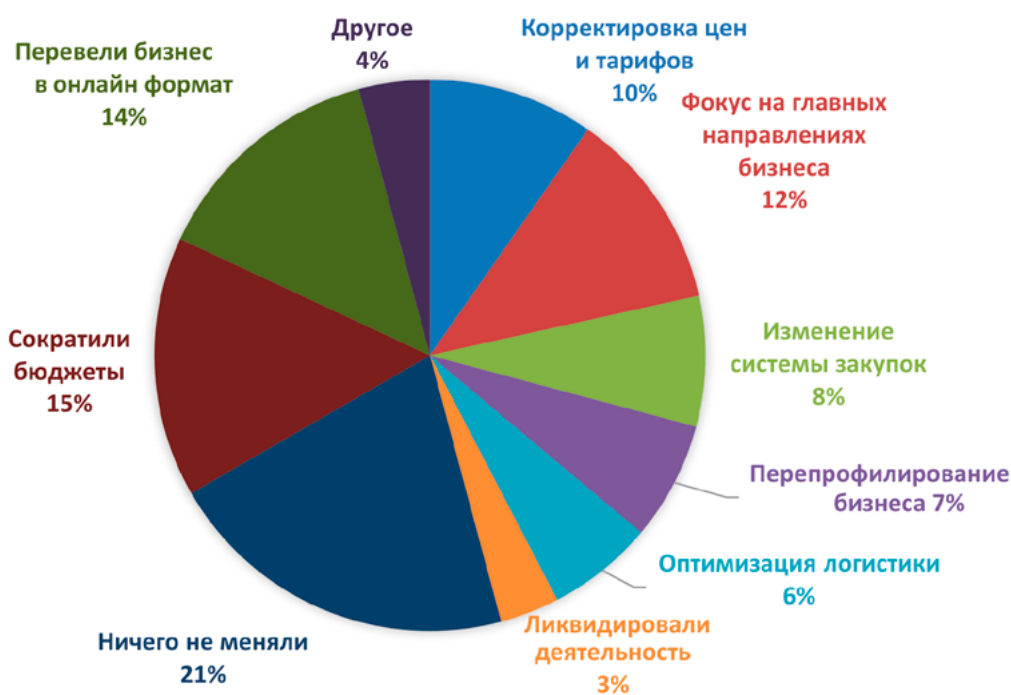
Рис. 3. Меры по сокращению негативного влияния кризиса 2020 г.

Невозможность некоторых предприятий работать удаленно приводит к тому, что страх людей приводит к отсутствию определенной доли штата сотрудников на рабочем месте. Как правило это больше относится к людям старшего поколения.