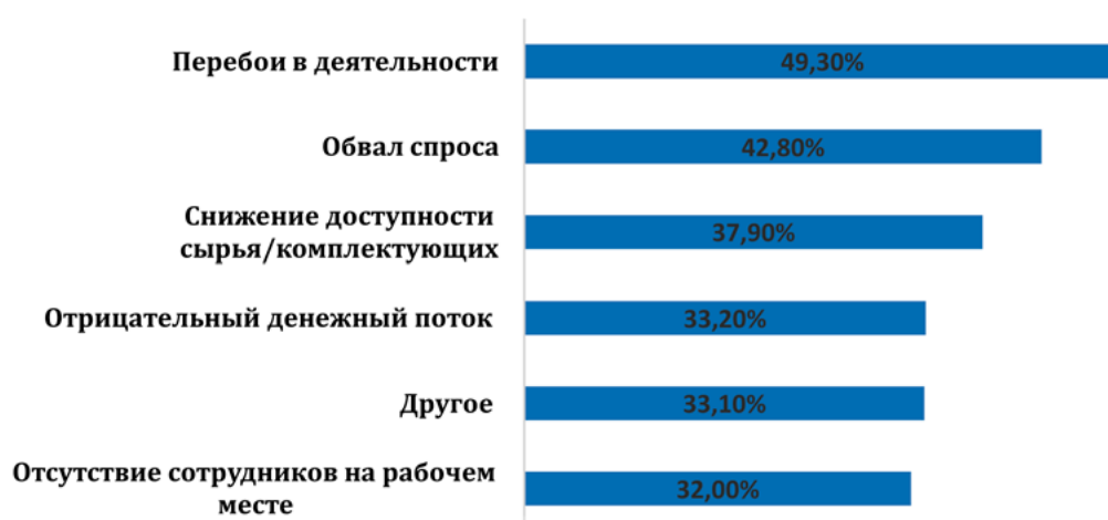
Рис. 2. Факторы, влияющие негативно на эффективность МСБ, % от опрошенных