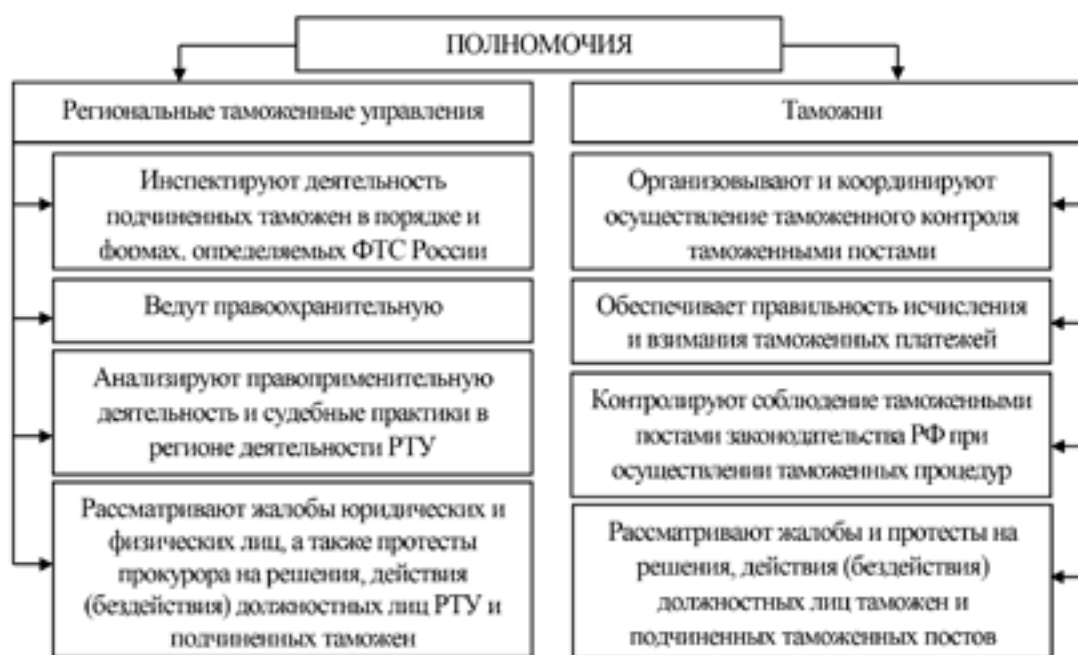
Рис. 4. Основные полномочия региональных таможенных управлений и таможен