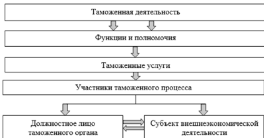
Рис. 5. Таможенные услуги в таможенной деятельности

Изучение различных интерпретаций термина «таможенная услуга» показывает разнообразие подходов у специалистов в этой области. Такие авторы, как А.А. Виниченко, Н.И. Осипенко и Д.В. Колчева, связывают это понятие с активностью таможенных органов, направленной на выполнение государственных задач, обеспечение экономической стабильности страны и отвечающей на запросы субъектов внешнеэ-