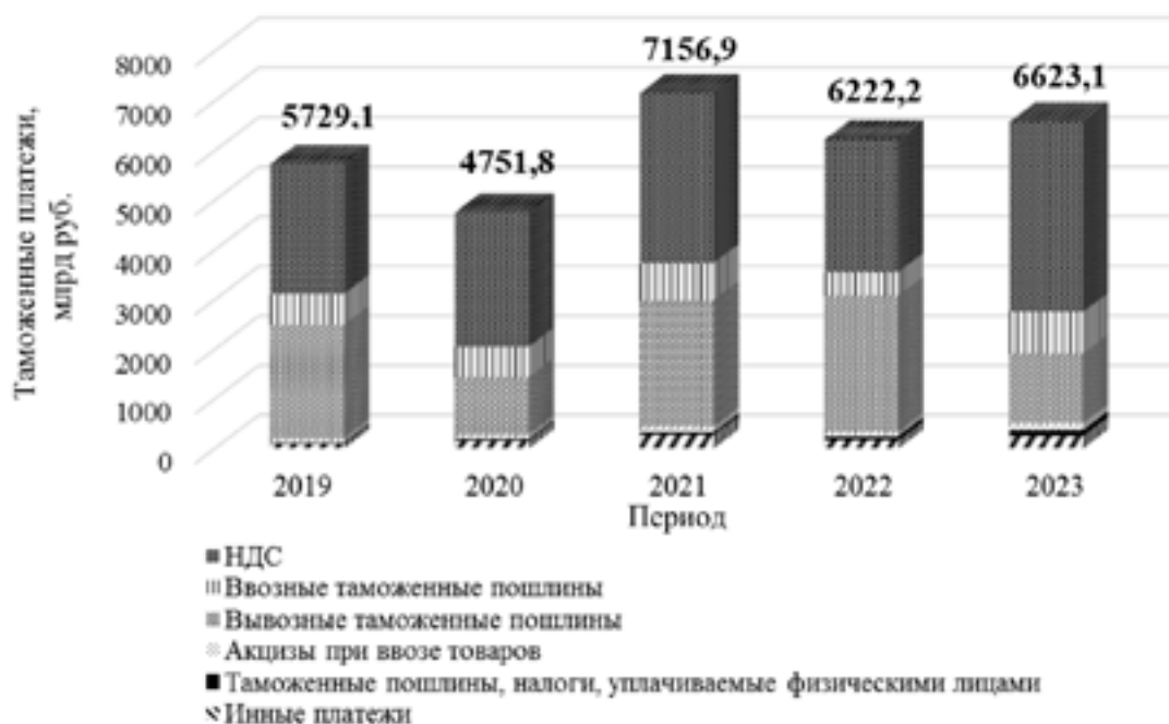
Рис. 2. Динамика и структура таможенных платежей, поступающих в доходную часть федерального бюджета Российской Федерации в 2019-2023 гг.

В нынешние времена таможенные службы, являясь элементом экономической инфраструктуры страны, помимо обеспечения традиционных задач госу-