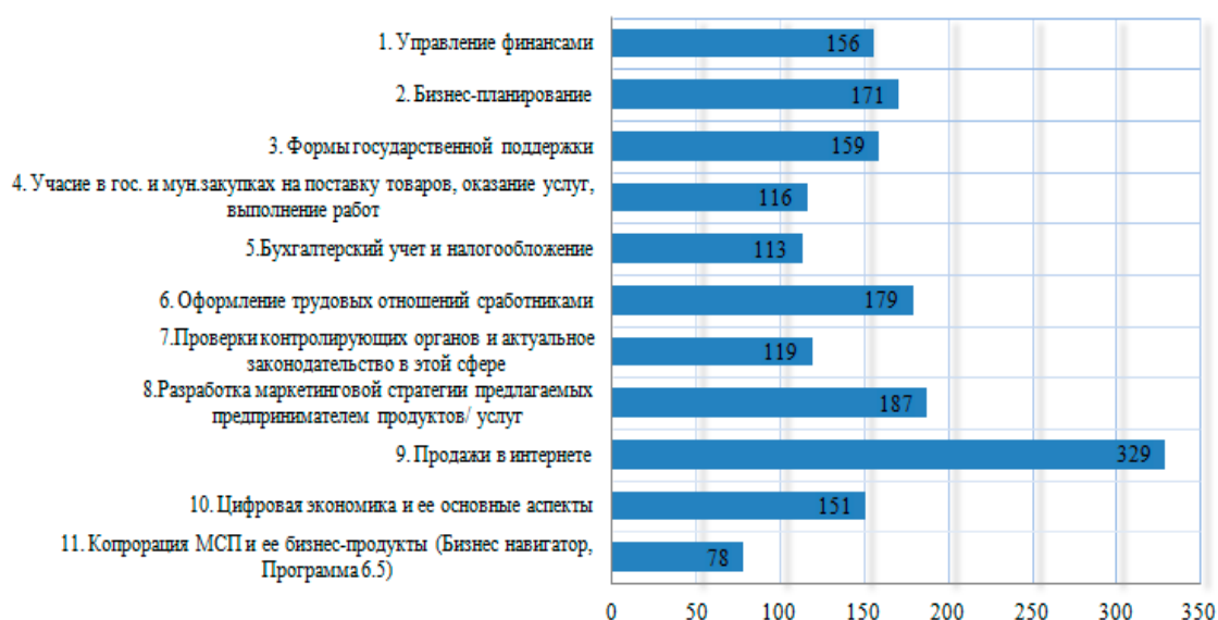
Рис. 3. Результаты опроса о приоритетных направлениях образовательных мероприятий (в процентах от общего количества участников исследования) [12]

Выделим, что основным стратегическим направлением в развитии малого и среднего бизнеса в Ростовской области считаем обретение новых знаний и навыков в сфере цифровой трансформации бизнеса.