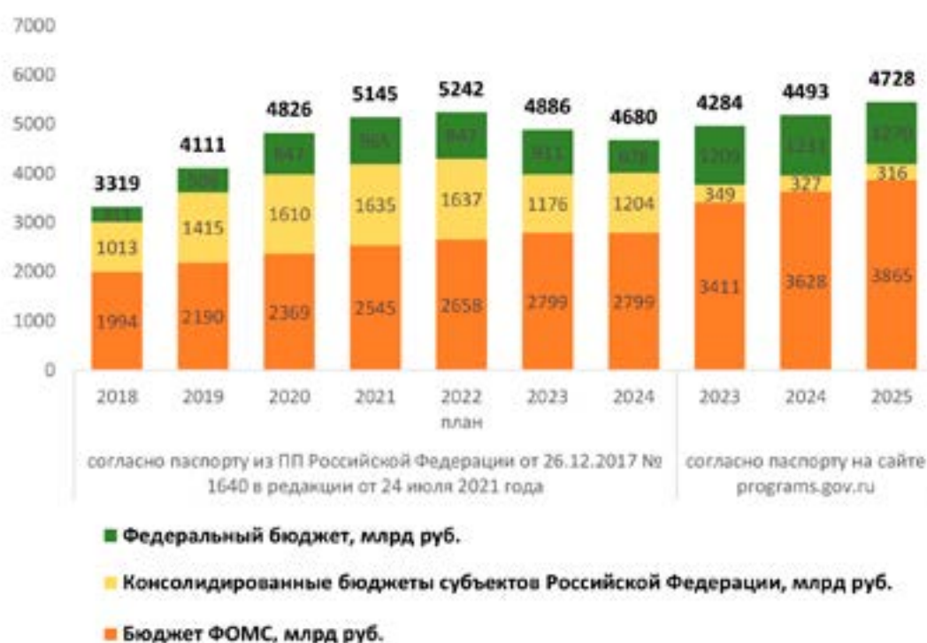
Рис. 1. Анализ источников финансирования ГП «Развитие здравоохранения»