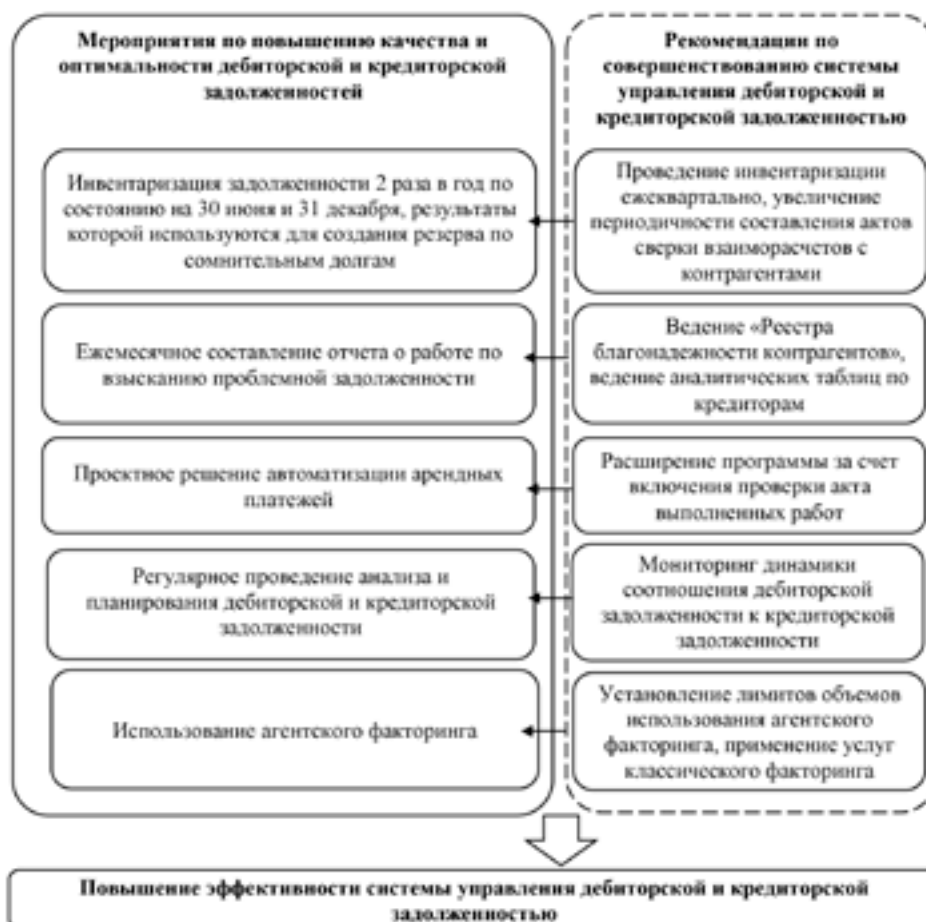
Рис. 2. Мероприятия по повышению эффективности системы управления дебиторской и кредиторской задолженностью в ОАО «РЖД»