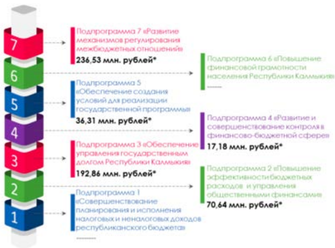
Рис. 2. Расходы на реализацию ГП «Управление государственными финансами Республики Калмыкия» [4]