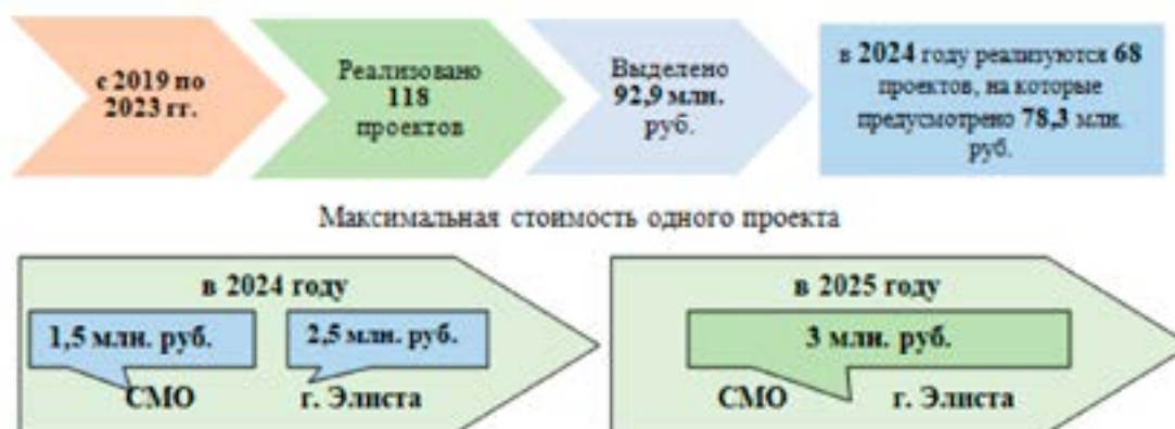
Рис. 7. Реализация проектов инициативного бюджетирования