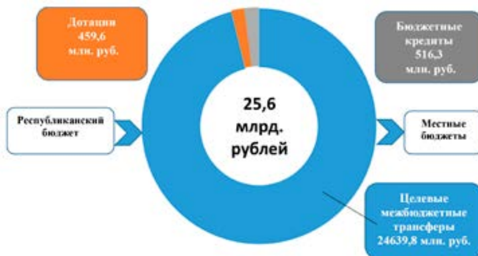
Рис. 5. Межбюджетные трансферты местным бюджетам за 2022-2023 гг. и 9 мес. 2024 г.