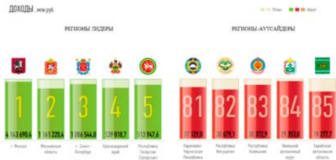
Рис. 1. Рейтинг топ-регионов и регионов аутсайдеров по формированию дохода бюджета на 1.11.2024 г.