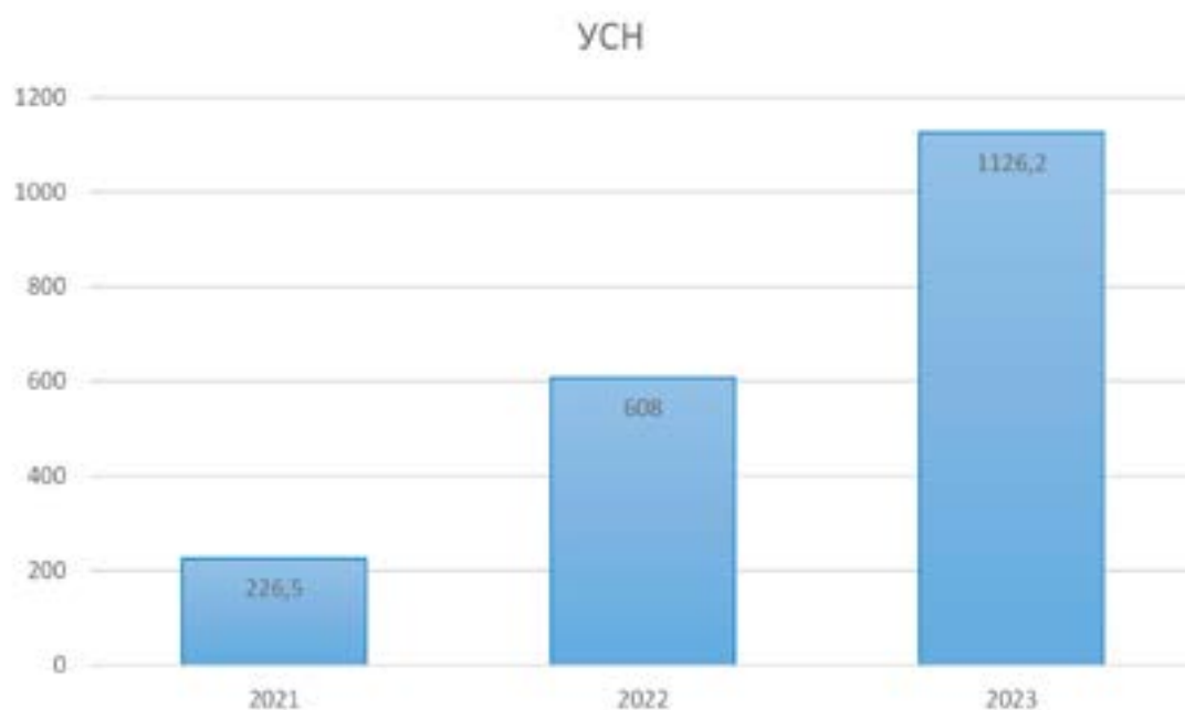
Рис. 4. Динамика поступления налога, взимаемого в связи с применением упрощенной системы налогообложения за 2021-2023 гг., млн. руб.

Благодаря своевременно принятым мерам на федеральном и региональном уровнях по стабилизации экономики, налоговые и неналоговые доходы