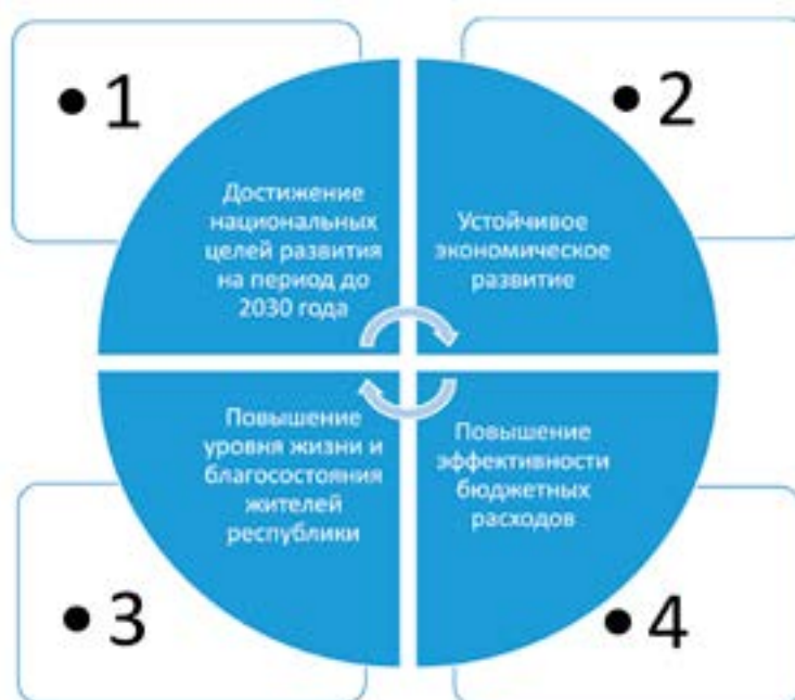
Рис. 8. Ключевые направления бюджетной политики республиканского бюджета на 2025-2027 гг.

Основное увеличение поступлений доходов бюджета республики в 2022 году обеспечили налог, взимаемый в связи с применением упрощенной системы налогообложения (УСН), налог на доходы физических лиц, налог на имущество организаций. Поступления налога по УСН составили 1,2 млрд. рублей выросли в 3 раза, это обусловлено увеличением количества налогоплательщиков на территории республики. По налогу на доходы физических лиц, который занимает 25% в объеме доходов, поступления со-