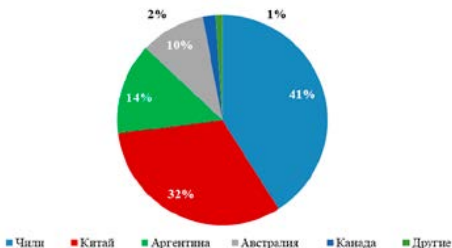
Рис. 1. Запасы литиевого сырья по странам