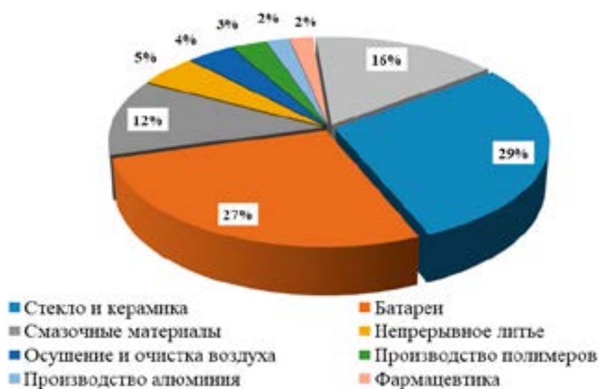
Рис. 3. Сегментация потребления литиевой продукции

До 1995 г. в мировой промышленности литий в большинстве случаев добывался из пегматитового сырья. В Российской Федерации подобным источником была сподуменовая руда, которая находилась в Завитинском месторождении в Восточной Сибири. Переработка данной руды осуществлялась на «Забайкальском горно-обогатительном комбинате» (ЗаБГОК), откуда сподуменновый концентрат поступал на «Красноярский химико-металлургический завод» (ХМЗ), а затем в виде гидроксида лития – на ПАО «НЗХК».