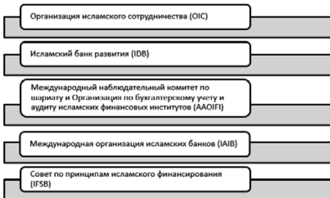
Рис. 1. Организации, регулирующие исламские финансы и учет