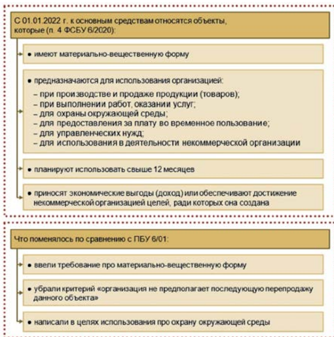
Рис. 2. Критерии для основных средств с 01.01.2022 г. – сравнение ФСБУ 6/2020 и ПБУ 6/01

Каких-либо сильных различий в определении СПИ между вновь задействованными ФСБУ и до этого момента работающего ПБУ 6/01, не наблюдается. Следовательно, при выборе СПИ организации могут продолжить использовать знакомую классификацию основных средств.