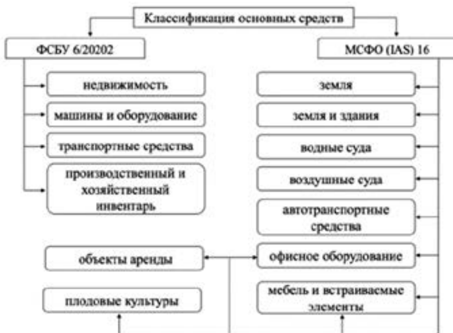
Рис. 4. Классификация основных средств в соответствии с ФСБУ 6/2020 и МСФО (IAS) 16 [9]

По ФСБУ 6/2020 «Основные средства» и МСФО (IAS) 16 «Основные средства» классификация основных средств представлена в виде схемы на рисунке 4.