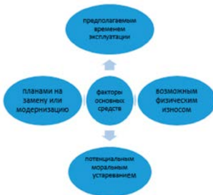
Рис. 1. Факторы, определяющие срок полезного использования основного средства

Определение срока полезного использования (СПИ) объектов основных средств обусловлено множеством факторов (рис. 1).