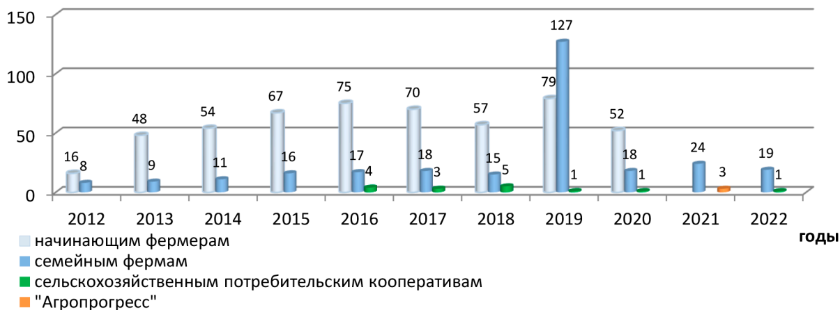
Рис. 4. Количество грантов, предоставляемых в рамках Госпрограммы «Развитие сельского хозяйства и регулирование рынков сельскохозяйственной продукции, сырья и продовольствия Оренбургской области» в период 2012 – 2022 гг.