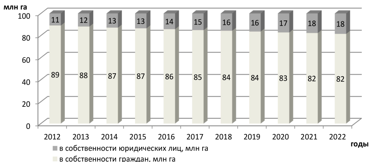
Рис. 2. Структура частной собственности на земли сельскохозяйственного назначения РФ

Банкротство вновь созданных сельскохозяйственных предприятий стало катализатором перераспределения земель между сельскими товаропроизводителями. Часть участников обанкротившихся предприятий, являясь собственниками земли, сдавали в аренду свои земельные участки более эффективным производителям сельскохозяйственной продукции, в роли которых чаще выступали крестьянские (фермерские) хозяйства. Другие, выходя из сельхозпредприятий, организовывали собственные крестьянские (фермерские) хозяйства или занимались личным подсобным хозяйством. Отсутствие возможности эффективно использовать земельные участки приводило к отказу собственников от своих прав на землю. Такие случаи тоже отмечались. Часть земель после банкротства предприятия не использовалась, часть переходила в общую долевую собственность. Такая ситуация была характерна до 2012 года. Начиная с 2012 года, собственники земельных долей предпочитали продавать свои доли на основе договоров купли-продажи. Результатом стал рост доли земель, находящихся в собственности юридических лиц (рис. 2).