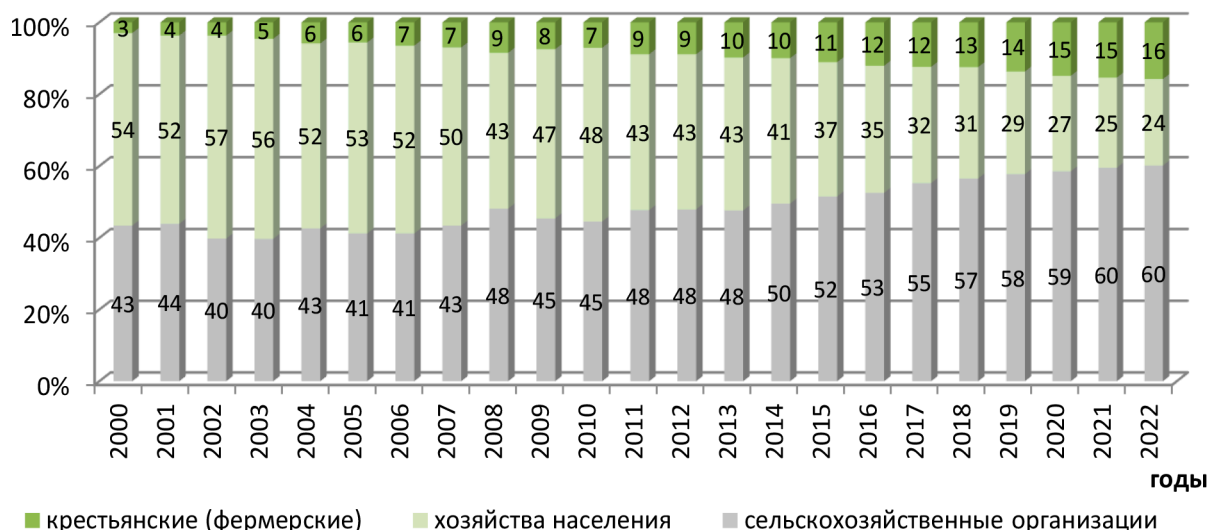
Рис. 3. Структура продукции сельского хозяйства России по категориям хозяйств

Одновременно с изменением собственности на земли сельскохозяйственного назначения происходило становление и развитие сельских товаропроизводителей (рис. 3).