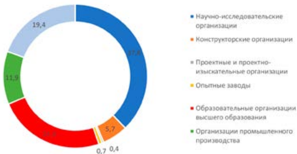
Рис. 2. Структура организаций, выполнявших исследования и разработки, в Российской Федерации в 2023 г., %

Источник: построено по данным НИУ ВШЭ. Режим доступа: https://issek.hse.ru/mirror/pubs/share/1013106714.pdf (дата обращения: 10.07.2025)