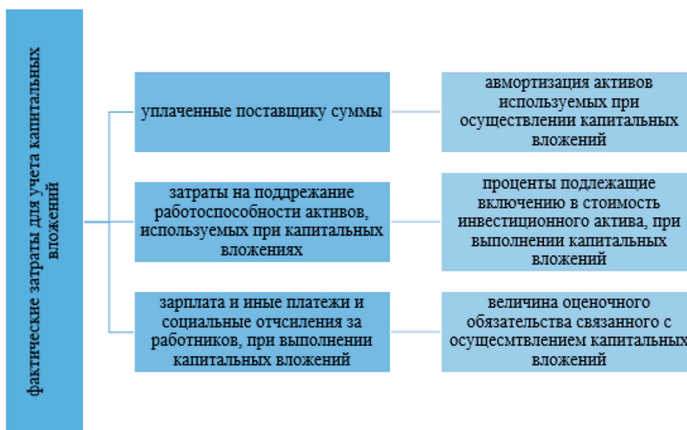
Рис. 3. Фактические затраты в составе капитальных вложений

Для цели учета капитальных вложений к фактическим затратам относят следующие затраты (рис. 3).