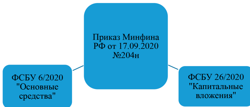
Рис. 1. Стандарты, регулирующие учет вложений и основные средства