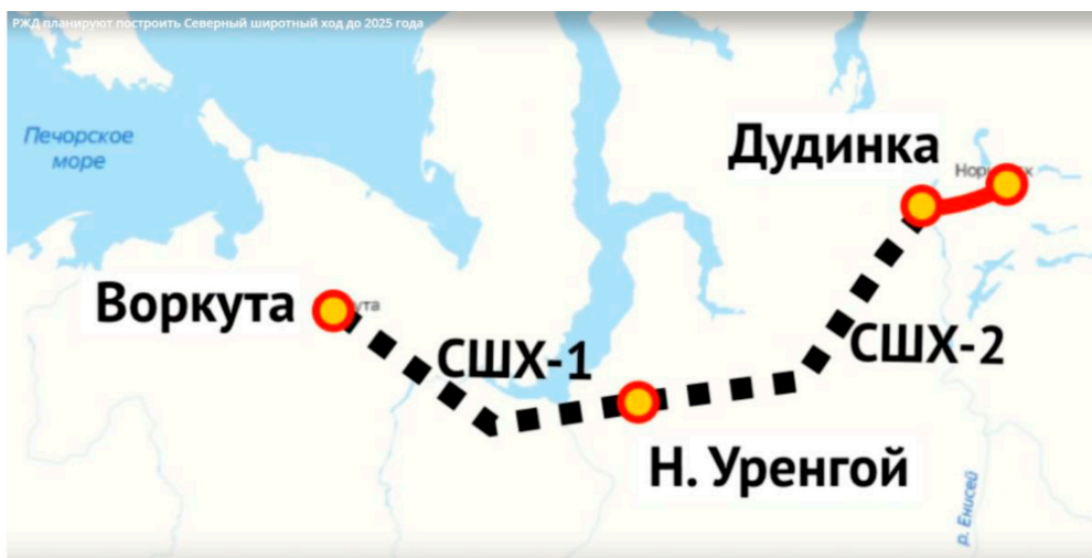
Рис. 1. Северный широтный ход 1 и 2 протяженностью 707 км, соединяющий Норильскую ж.д. с центральными регионами страны [10]