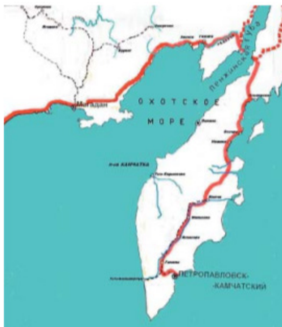
Рис. 3. Ленско-Камчатская магистраль по разработке Э. А. Нормана с Магадана до Пенжинской губы 720 км и от неё до Петропавловск-Камчатского 1170 км по низинам