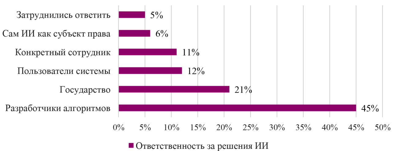
Рис. 1. Ответственность за решения ИИ (по данным ВЦИОМ, 2024 г.) [8]

Осознавая остроту этих проблем, мировое сообщество инициирует регуляторные ответы. В Европейском союзе «Акт об искусственном интеллекте» относит системы ИИ, используемые государственными органами, к категории высокого риска, накладывая на них строгие требования к прозрачности, документированию и человеческому надзору. В России этот вопрос находится на стадии обсуждения: после принятия в 2020 году Концепции регулирования ИИ [4], в 2024 году был внесен соответствующий законопроект «Об искусственном интеллекте», предлагающий ввести категоризацию рисков.