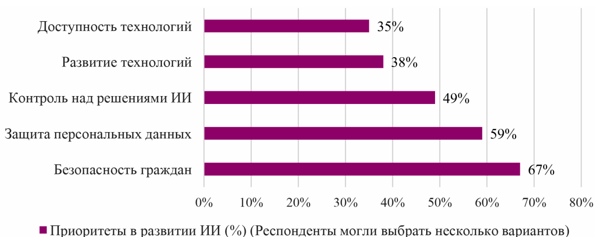
Рис. 3. Приоритеты граждан в области регулирования ИИ (по данным ВЦИОМ, 2024 г.) [7]

Систематизация ключевых проблем, порождаемых внедрением искусственного интеллекта в налоговую сферу, и поиск адекватных мер реагирования на них является центральной задачей для обеспечения правовой и этической состоятельности этого процесса. Для наглядности предлагается рассмотреть комплекс мер в таблице 2.