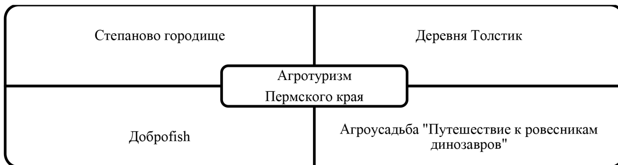
Рис. 3. Современный агротуризм Пермского края