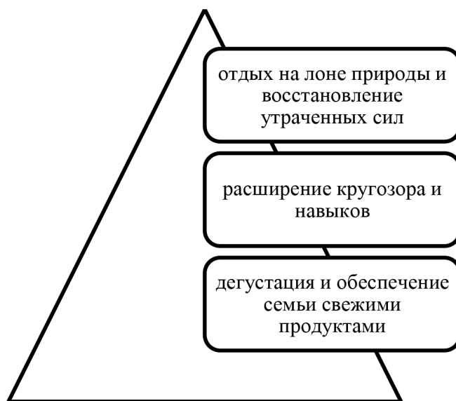
Рис. 2. Преимущества агротуризма

В рамках агротуризма путешественникам предлагается: