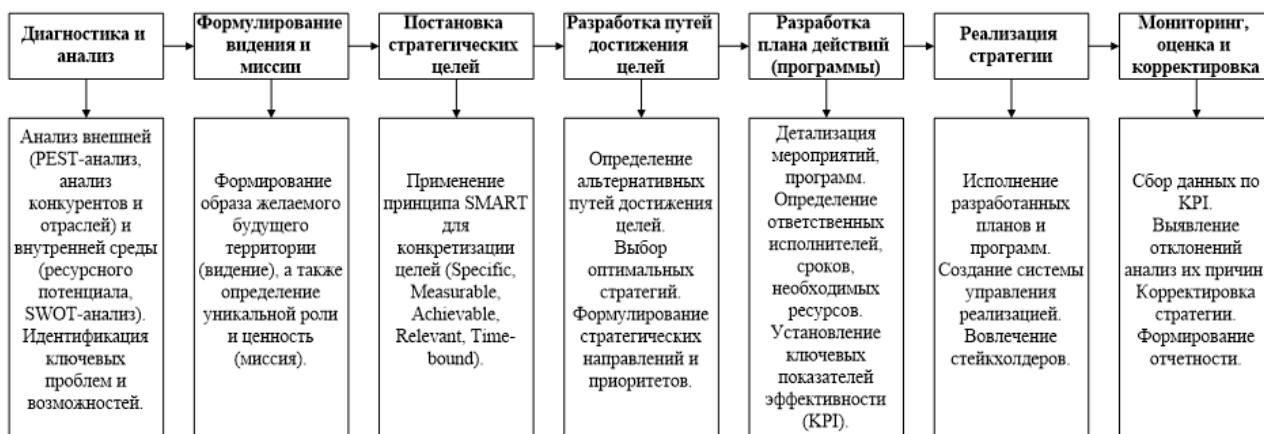
Рис. 1. Этапы стратегического планирования