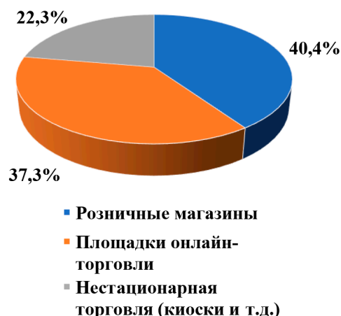
Рис. 2. Статистика по каналам продаж нелегальной продукции