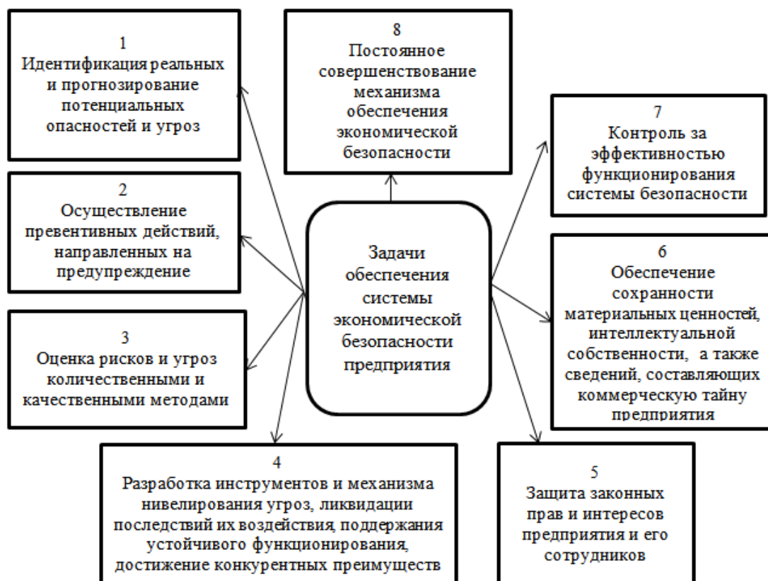
Рис. 2. Задачи системы экономической безопасности предприятия

Именно наличие угроз и вынуждает обеспечивать безопасность организации. Учет влияния деструктивных факторов, возможность их своевременного выявления и устранения является необходимым условием выживания предприятия, защиты его экономических интересов. Таким образом, главной целью ЭБП является формирование условий для обеспечения надежной и сверхэффективной жизнедеятельности предприятия за счет защиты его интересов от внешних и внутренних угроз. Достижение данной цели невозможно без реализации задач системы экономической безопасности предприятия (рис. 2).