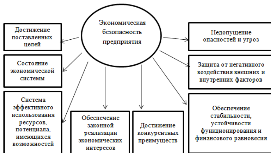
Рис. 1 Подходы к определению экономического потенциала предприятия

Таким образом, рассмотрев ряд трактовок, можно сказать, что экономическая безопасность предприятия (ЭБП) представляет собой и эффективное использование ресурсов, и особое состояние самого предприятия, и комплекс мероприятий направленных на защищенность, предотвращение угроз, а также способность к дальнейшему развитию и достижению конкурентных преимуществ (рис. 1).