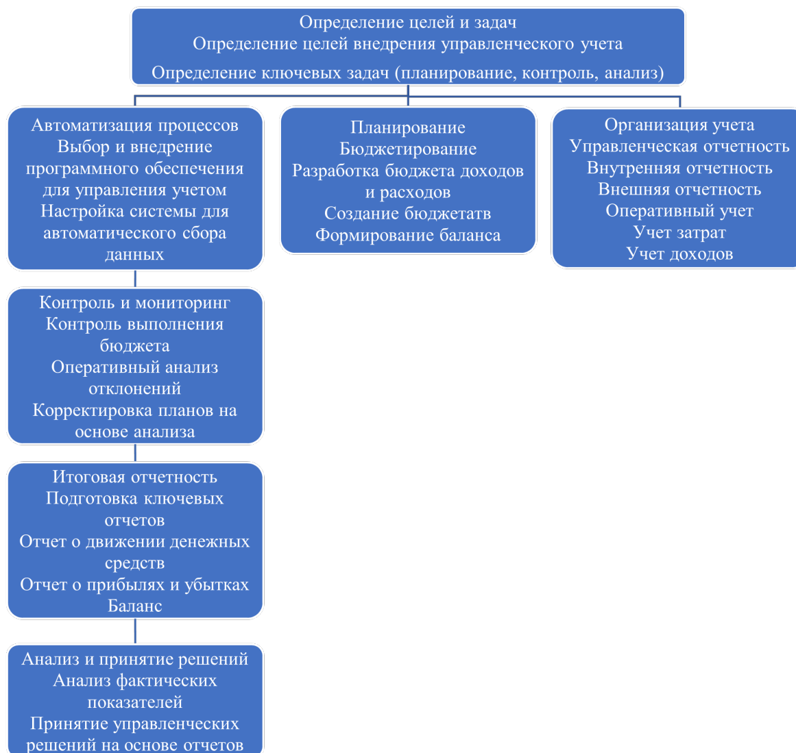
Рис. 2. Схема внедрения системы управленческого учета на предприятии [1]

Эффективность управленческого учета во многом зависит от правильности его внедрения и процесс внедрения включает последовательные этапы (рисунок 2).