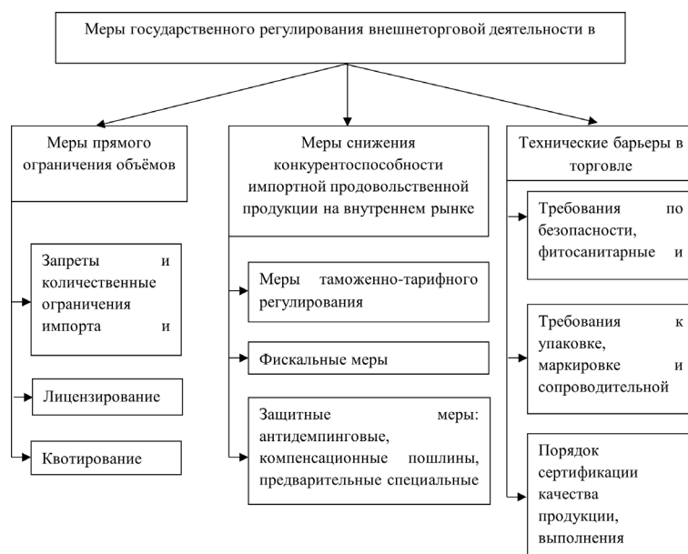
Рис. 1. Меры государственного регулирования, применяемые на территории Российской Федерации

Следовательно, инструментарий государственной политики в области международного товарообмена в контексте поддержания продовольственной безопасности России характеризуется многоплановостью и значительным охватом входящих в него областей. Рассмотрим основные меры регулирования внешнеторговой деятельности на рисунке 1.